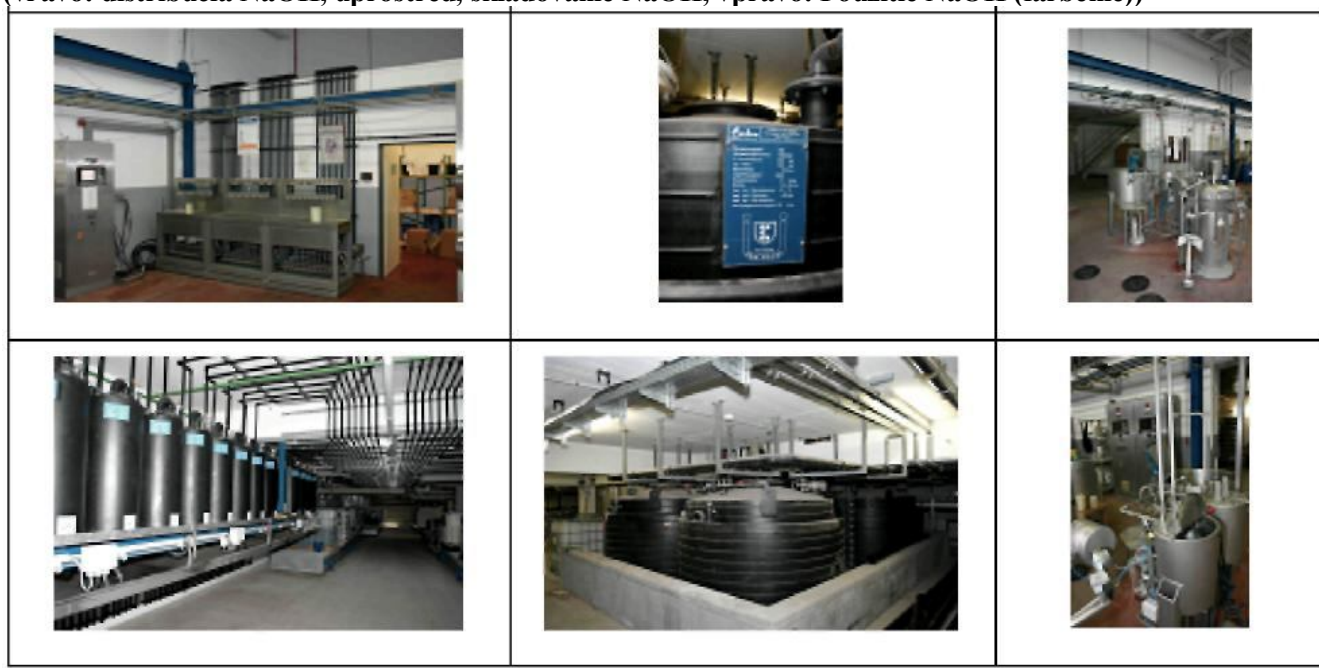
Obr. 1: Dnes sa v textilnom priemysle NaOH používa v uzavretých systémoch, bez expozície pracovníkov (vľavo: distribúcia NaOH, uprostred, skladovanie NaOH, vpravo: Použitie NaOH (farbenie))